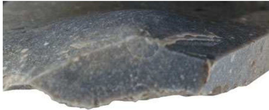
↑ Schlagpunkt mit kreisförmigem Schlagauge

Der Schlagpunkt ist die Stelle, an der der Trennschlag einsetzte. Gelegentlich erscheint dicht um den Punkt eine feine Linie, sie ist der Ansatz des Schlagkegels. Es handelt sich um einen feinen, kreisförmigen Mikroriss, der durch das Einwirken der Schlagenergie entsteht, auch Schlagauge genannt. Schlagaugen können auch durch Bestoßungen im Geröll entstehen und müssen nicht zwangsläufig zu einer Abtrennung führen.