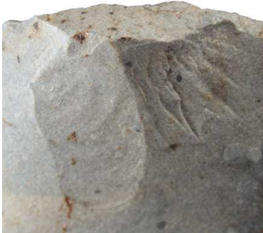
↑ Lanzettsprünge rechts neben Schlagnarbe